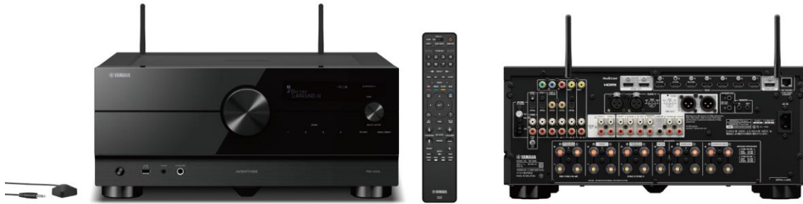
ヤマハ AV レシーバー 『RX-A6A』 カラー：(B) ブラック 希望小売価格 275,000 円（税抜 250,000 円）

https://jp.yamaha.com/products/audio_visual/av_receivers_amps/rx-a8a/index.html