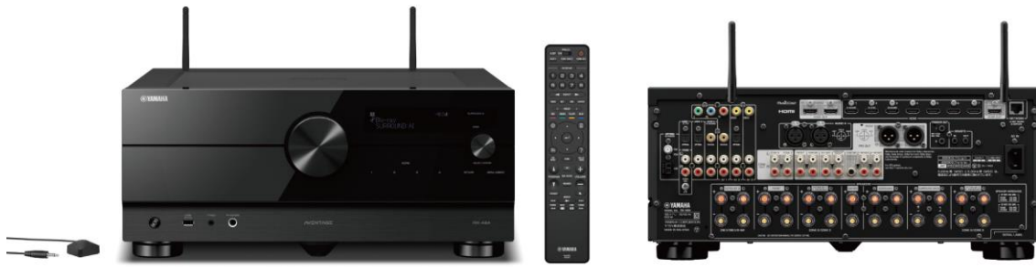
ヤマハ AV レシーバー 『RX-A8A』 カラー：(B) ブラック 希望小売価格 418,000 円（税抜 380,000 円）