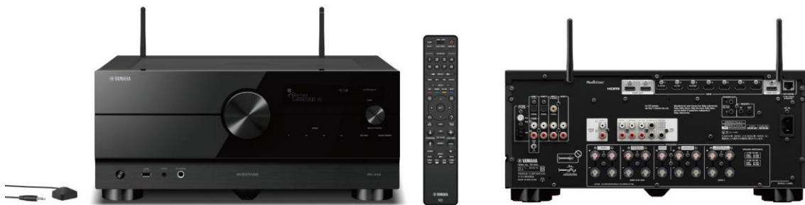
ヤマハ AV レシーバー 『RX-A4A』 カラー：(B) ブラック 希望小売価格 132,000 円（税抜 120,000 円）

https://jp.yamaha.com/products/audio_visual/av_receivers_amps/rx-a6a/index.html