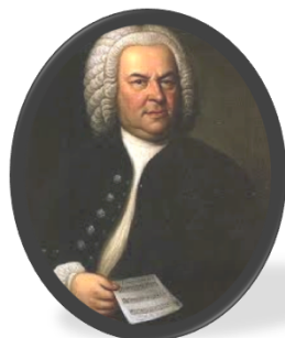
Johann Sebastian Bach (1685-1750)