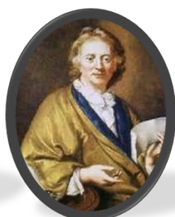
François Couperin (1668-1733)