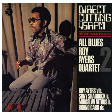
写真 2. ロイ・エアーズ・カルテットのダイレクト・カット盤

1969年になってステレオレコード以降の最初ともいえるダイレクト・カットの本格的なレコーディングセッションが行われ、そのレコードが発売された。キンテート・リアルというアルゼンチン・タンゴの本場アルゼンチンの名手たちを、赤坂の旧日本コロムビア第2スタジオに呼び、そのスタジオの出力信号を階下にある複数のカット・マシンに引き込む形で、この30cm 45回転盤2枚組のダイレクト・カット盤が実現された。この盤は1969年6月に発売され、話題を呼んだ。複数の4台のカット・マシンを使用したのは、カット・レベルの予測が出来ない中で、レベル設定を変えて確実に製品化を行うようにしたためである。この2枚組の中の1曲「エル・チョコロ」は、日本オーディオ協会の創立50周年記念CD及び創立60周年記念CDにも記録されており、その名演を楽しむことが出来る。肝心の金属原盤は手を尽くして探したが残念ながら破棄されていて見つからなかった。その後1969年9月にフラメンコの2枚組、同年11月にはジャズの2枚組が発売された。これらの金属原盤のほとんどは破棄されていてその探索は困難を極めた。フラメンコについては引き続き調査を続けているが、ジャズで奇跡的に30cm 45回転盤両面1枚分の金属原盤が見つかった。