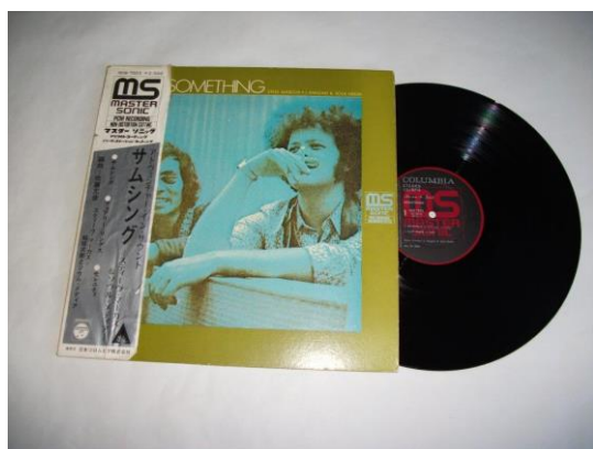
写真3. 1971年1月に発売された世界初のPCM/デジタル録音によるアナログレコード「サムシング/スティーブ・マーカス+稲垣次郎とソウルメディア」の外観

この時代を代表するもう一つのシーンは日本の打楽器奏者ツトム・ヤマシタが1970年にニューヨーク、ボストン、シカゴで大成功を博し、1971年1月21日に日本での凱旋帰国公演を行ったことである。その東京文化会館小ホールでの実況録音盤の金属原盤も残されていたのである。この2枚のレコードを以下に紹介する。