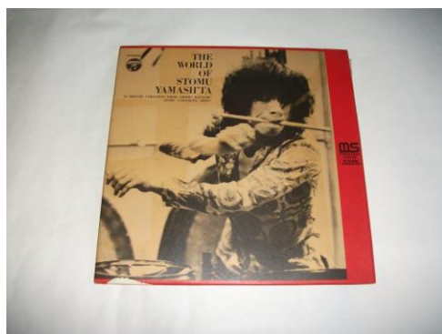
写真 4. 1971 年 1 月に発売された PCM/デジタル録音によるアナログレコード「打！—ツトム・ヤマシタの世界」の外観