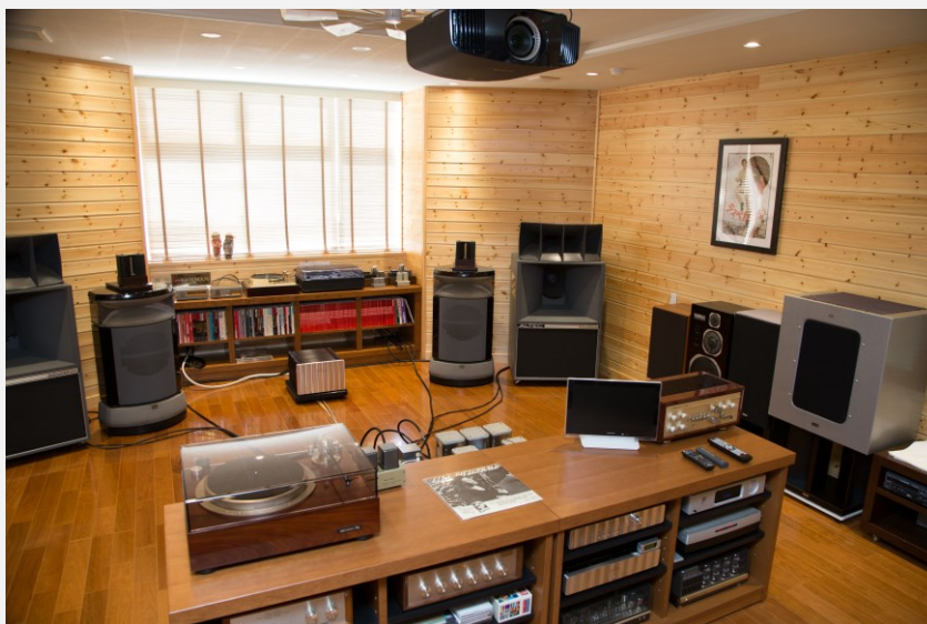
リスニングルーム後方のオーディオ機器

さらに、左には独立した約 62 平米の縦長の展示・リスニングルームがあり、部屋の前後に異なったオーディオ機器がセットされ、二つのリスニングルームとして機能するように配慮されています。その一方には天井にスクリーンが仕込まれ、ソニーの 4K プロジェクターによりハイレゾの映像も楽しめます。