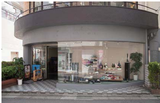
ホーム商会 ショーウィンド

ホーム商会は 1952 年、当時は高級品だったラジオを製作・販売する電気店として青山に開店したのがスタートです。1967 年、ホーム商会はその技術と経験を生かし、目黒区の学芸大学駅近くにオーディオ専門店を開きました。洒落た建物のショーウィンドウには高級オーディオ製品が並び、当時近くに住んでいた私は、勤めの行き帰りにしばしの目の保養をしたものでした。JBL、アルテック、タンノイ、マランツ、マッキントッシュ、SME、ガラードなどなど、世界の名機もこの小さな街のウィンドウに並び、商店街に華を添えていました。