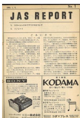
JAS Report 1960年発行の1号誌