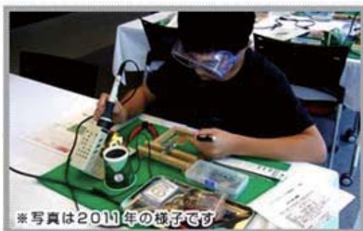
*写真は2011年の様子です