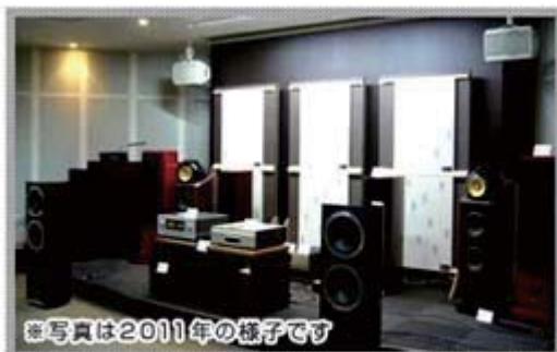
*写真は2011年の様子です